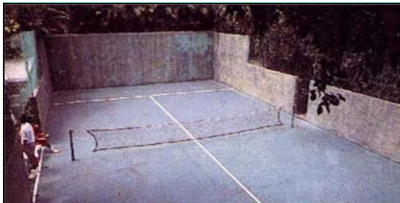
La primera pista de pádel, construida por Enrique Corcuera

En España, el padel comienza a expandirse a las grandes ciudades y clubes deportivos de Madrid, Barcelona Andalucía, Galicia y País Vasco. Se crea la infraestructura necesaria para la práctica de este deporte por todo el país y de organizar el Circuito Nacional de Torneos que se desarrollará en los clubes más prestigiosos del país.